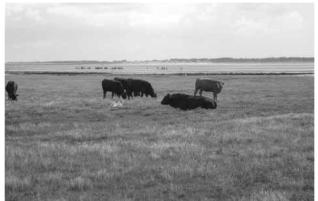
Photo 3. Exemple de marais salés sur le côté est de l'île d'Amrun. Ce type d'environnement est inondé entre 20 et 200 fois par an. En premier plan derrière les bovins, un lit de Limonium vulgare , une plante résistante au sel. En arrière plan, on aperçoit l'île de Foehr. Ces deux îles montrent des témoins de matériel glaciaire, différent du matériel post-glaciaire des îles marécageuses et de Halligen.

groupe de trois îles : Neuwerk (300 ha), Scharhörn (20 ha, dunes de sable), Nigehörn (34 ha, création artificielle), qui se trouvent directement à l'embouchure de l'Elbe près de Cuxhaven. Les sentiers de randonnée y sont nombreux.