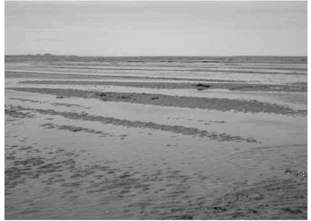
Photo 2. Restes d'un paysage agricole perdu lors des tempêtes du XII e siècle qui ont détruit les marais tourbeux. La mer de Wadden au nord de la Frise constituait un paysage tourbeux jusqu'au Moyen Âge, protégé par ce qui restait des moraines saaliennes à l'ouest.